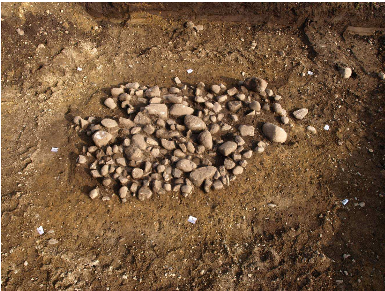
Fig. 2. Stenlægning. Omtrentlig nord mod højre.