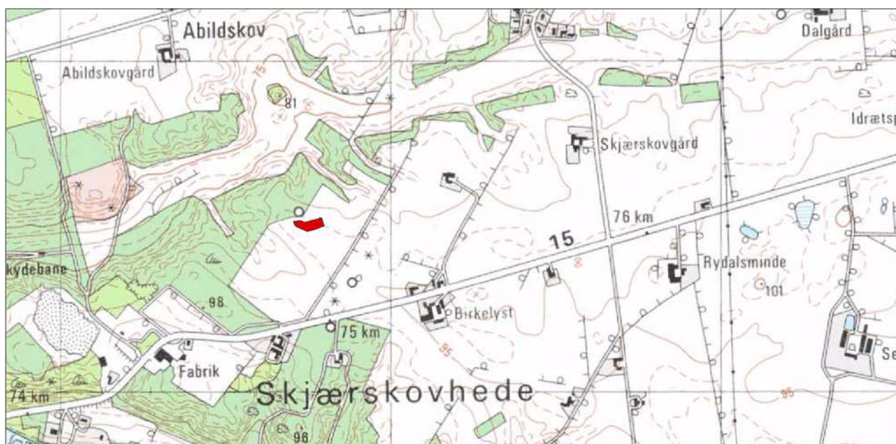
Fig. 1. Undersøgelsesområdets beliggenhed markeret med rødt. Den cirkulære form direkte nord for udgravningsfeltet er gravhøjen med SB-nr. 99.