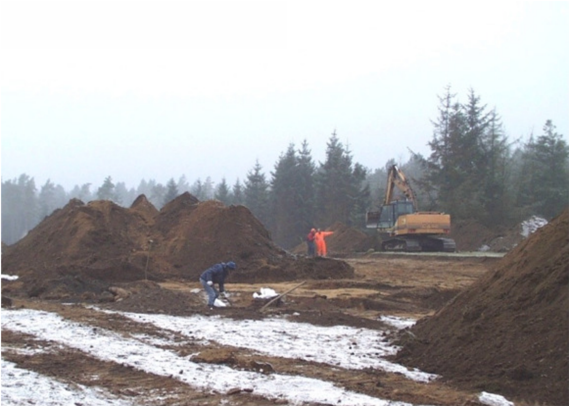
Udgravningssituation, november 2005.