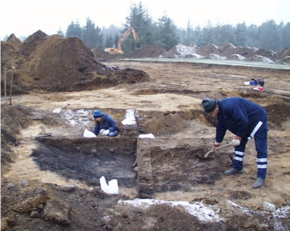
Stenalderhustomten XVIII under udgravning, november 2005.